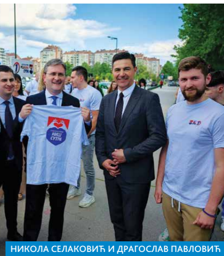
НИКОЛА СЕЛАКОВИЋ И ДРАГОСЛАВ ПАВЛОВИЋ

успешне трудноће“, а генерал Владимир Лазаревић на трибини је говорио о одбрани отаџбине. Ниш су посетили потпредседник ГО СНС др Владимир Орлић и чланови Председништва Никола Селаковић, Владимир Ђукановић и Зоран Томић, као и лидери коалиционих странака Ивица Дачић, др Војислав Шешељ, Милица Ђурђевић Станенковић и Драган Марковић Палма. Коалиција „Александар Вучић - Србија су-