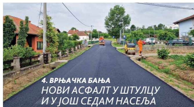
4. ВРЊАЧКА БАЊА НОВИ АСФАЛТ У ШТУЛЦУ И У ЈОШ СЕДАМ НАСЕЉА

формисања. Изграђене су теретане на отвореном у парку у Улици краља Петра Првог, иза Технолошког факултета и у насељу Солидарност. Завршен је потпорни зид у Делиградској улици, а у току је изградња водовдне мреже у Печењевицу. Одржана је изложба паса, турнир „три пута три“ у фудбалу и баскету, Дани јагоде, подељена су ауто-седишта новорођеним бебама.