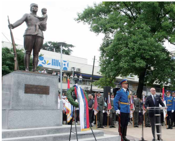
ПРЕМИЈЕР МИЛОШ ВУЧЕВИЋ НА ОТКРИВАЊУ СПОМЕНИКА МИЛУНКИ САВИЋ НА ВОЈДОВЦУ, ГДЕ ЈЕ ХЕРОИНА ИЗ ПРВОГ СВЕТСКОГ РАТА ЖИВЕЛА, УОЧИ ВИДОВДАНА, ЊЕНОГ РОЂЕНДАНА