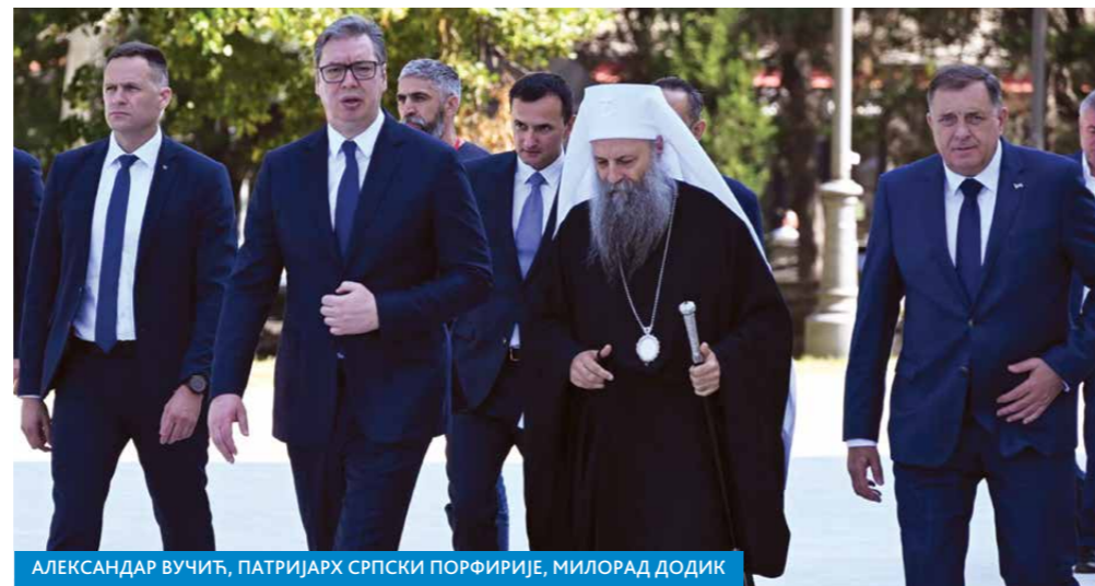
АЛЕКСАНДАР ВУЧИЋ, ПАТРИЈАРХ СРПСКИ ПОРФИРИЈЕ, МИЛОРАД ДОДИК

„Данас је постигнут договор о српском јединству које