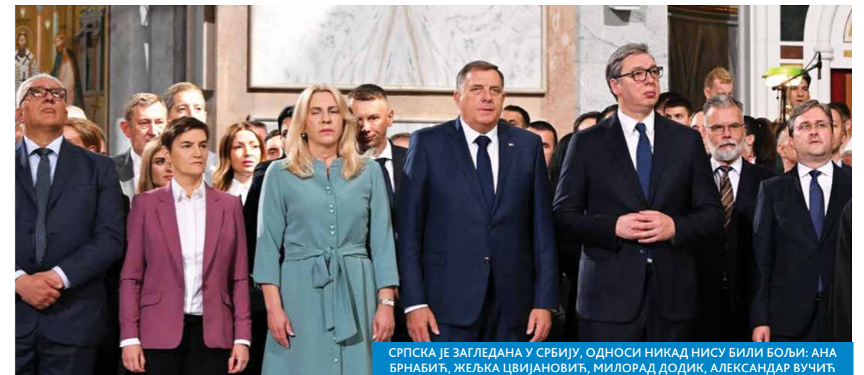
СРПСКА ЈЕ ЗАГЛЕДАНА У СРБИЈУ, ОДНОСИ НИКАД НИСУ БИЛИ БОЉИ: АНА БРНАБИЋ, ЖЕЉКА ЦВИЈАНОВИЋ, МИЛОРАД ДОДИК, АЛЕКСАНДАР ВУЧИЋ

терес је и економија, то смо назвали ЕКСПО 2027, а економија је суштина и прва тачка националне безбедности, то је од виталног интереса за све нас и оно што нам даје снагу“, рекао је председник Вучић и навео да Србија Републику Српску никад неће оставити на цедилу.