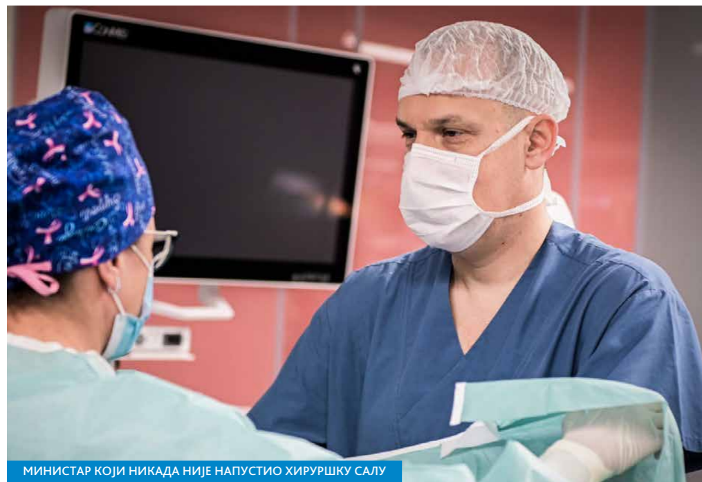
МИНИСТАР КОЈИ НИКАДА НИЈЕ НАПУСТИО ХИРУРШКУ САЛУ

Вучића, унапређење здравственог система ставила као апсолутни приоритет у протеклих 12 година.