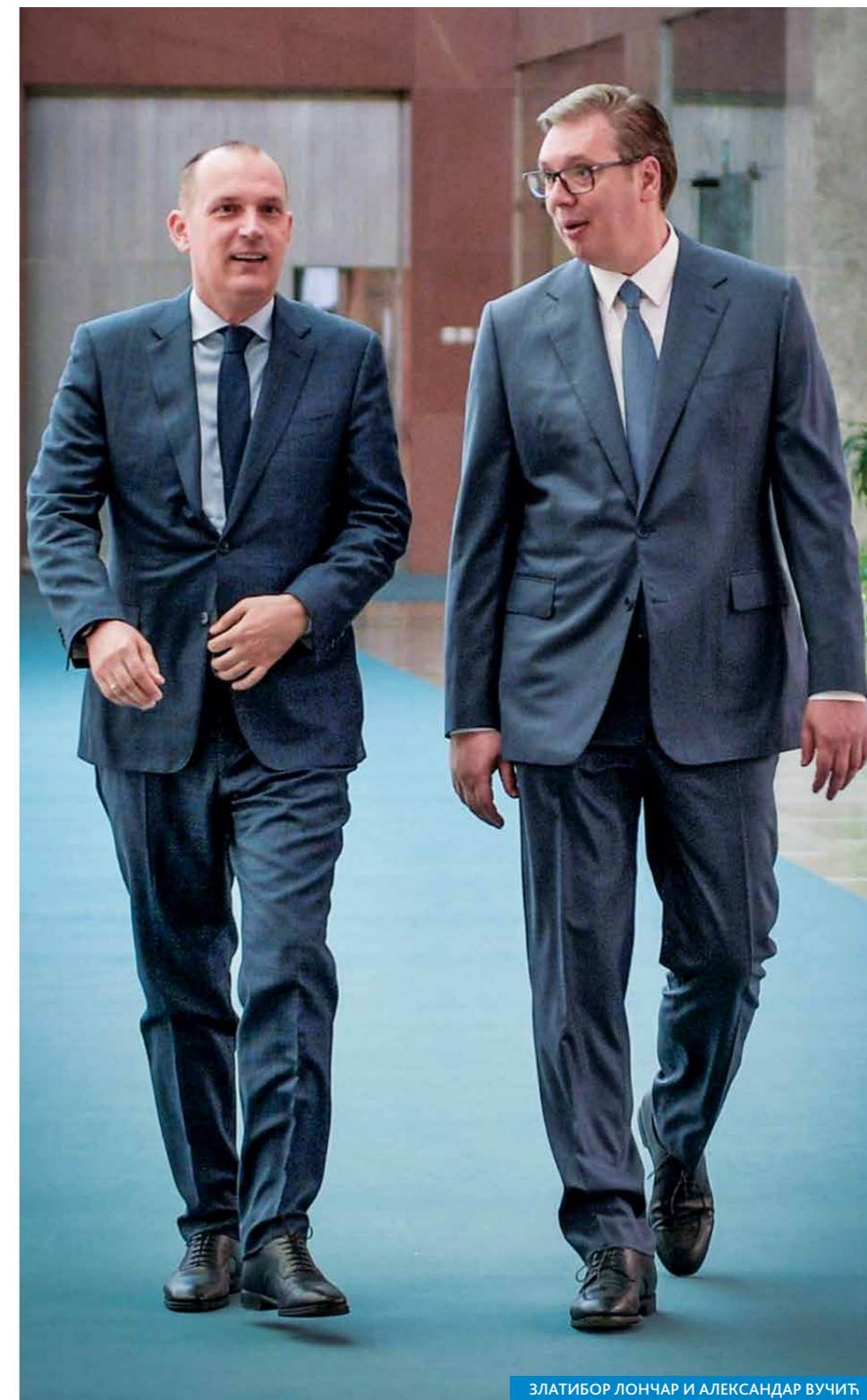
ЗЛАТИБОР ЛОНЧАР И АЛЕКСАНДАР ВУЧИЋ

ЗЛАТИБОР ЛОНЧАР, члан Председништва СНС и министар здравља