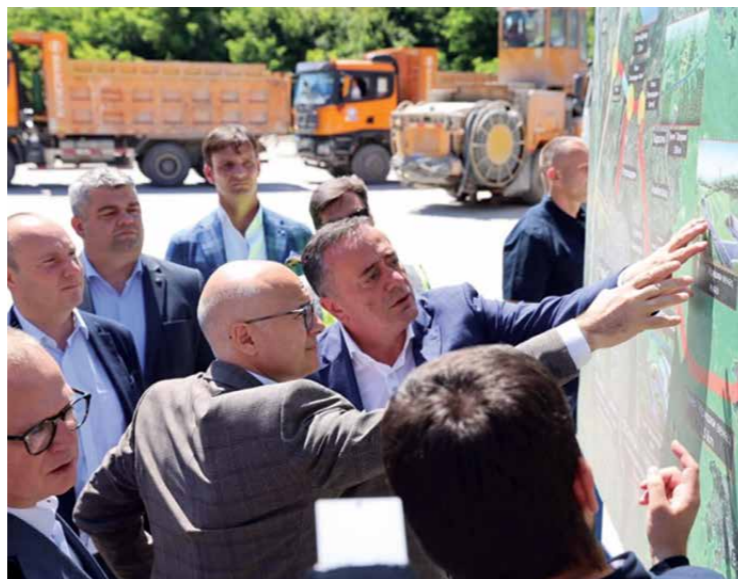
МИЛОШ ВУЧЕВИЋ ОБИШАО ЈЕ РАДОВЕ НА ИЗГРАДЊИ ТУНЕЛА „ИРИШКИ ВЕНАЦ“, У СКЛОПУ ОБИЛАЗНИЦЕ НОВИ САД - РУМА