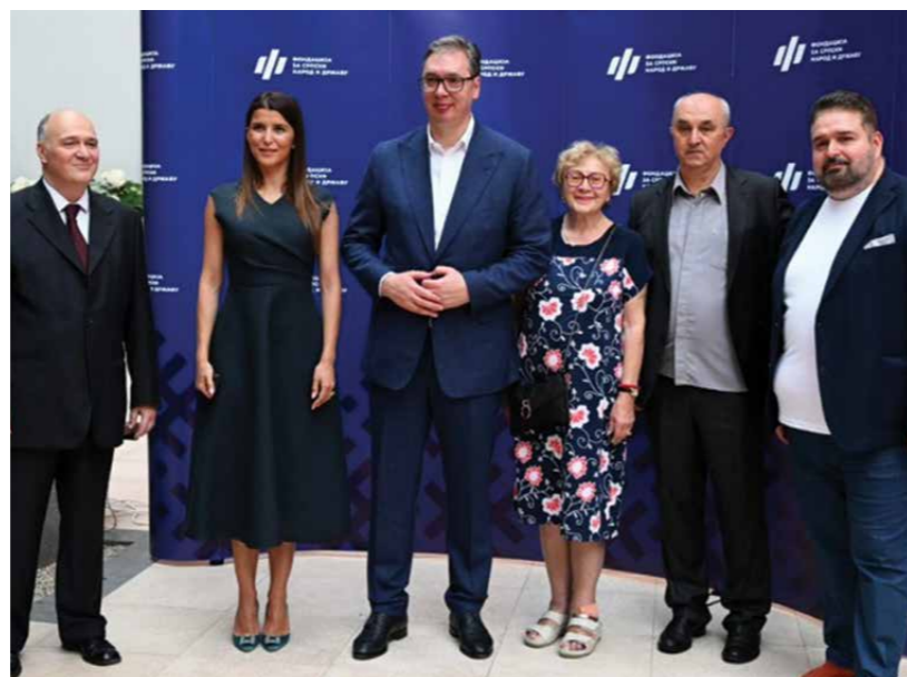
НА ПРОМОЦИЈИ НАУЧНОГ ЧАСОПИСА „НАПРЕДАК“, КОЈИ ИЗДАЈЕ ФОНДАЦИЈА ЗА СРПСКИ НАРОД И ДРЖАВУ