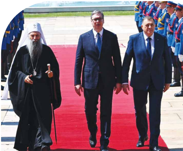
ПРЕДСЕДНИК СРБИЈЕ АЛЕКСАНДАР ВУЧИЋ, ПОВОДОМ ПРВОГ СВЕСРПСКОГ САБОРА, САСТАО СЕ СА ПРЕДСЕДНИКОМ РЕПУБЛИКЕ СРПСКЕ МИЛОРАДОМ ДОДИКОМ И СА ПАТРИЈАРХОМ СРПСКИМ ПОРФИРИЈЕМ