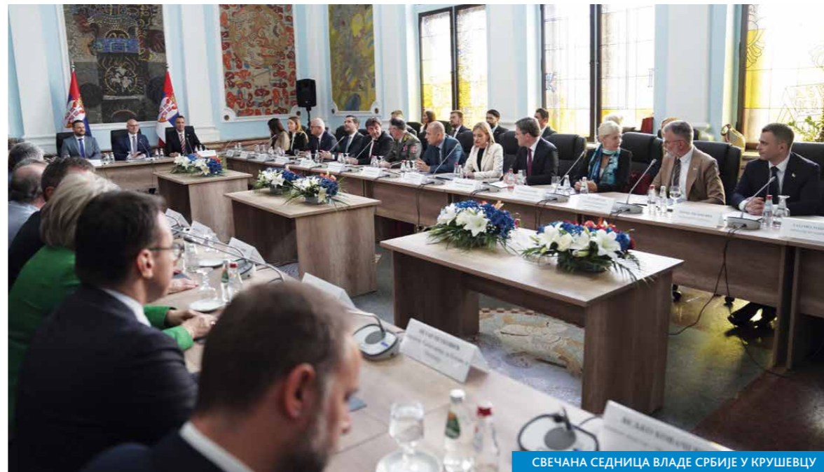
СВЕЧАНА СЕДНИЦА ВЛАДЕ СРБИЈЕ У КРУШЕВЦУ

јунака, који су пре 635 година пали на Косову за крст часни и слободу златну, буду снага и сила на основу којих ћемо доносити наше одлуке. Наши преци падали су славно да бисмо ми данас били сложни и уједињени око Србије. Гледајмо у будућност и нове изазове, са истом видовданском храброшћу и одлучношћу која је увек водила наш народ. Будимо као један, радни и вредни, мудри и предани, и чекајмо дан васкрса и славе, а свануће нова зора. Живела Србија“, поручио је премијер Вучевић.