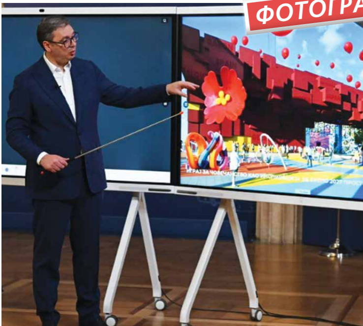
НЕОПХОДНО ЈЕ ДА СЕ СВИ АНГАЖУЈЕМО ОКО ЕКСПО 2027, КОЈИ ЈЕ ПРЕКРЕТНА ТАЧКА ЗА РАЗВОЈ СРБИЈЕ У СВАКОМ СМISЛУ, ПОРУЧИО ЈЕ ПРЕДСЕДНИК ВУЧИЋ У ОБРАЋАЊУ НАЦИЈИ ИЗ ПРЕДСЕДНИШТВА СРБИЈЕ