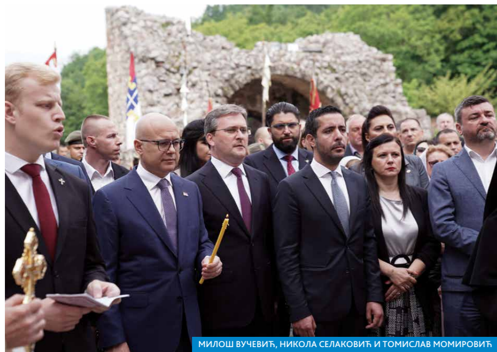
МИЛОШ ВУЧЕВИЋ, НИКОЛА СЕЛАКОВИЋ И ТОМИСЛАВ МОМИРОВИЋ

Поводом великог српског државног и верског празника Видовдана, премијер Србије Милош Вучевић присуствовао је парастосу кнезу Лазару и косовским јунацима у манастиру Раваница, који је и задужбина кнеза Лазара, у којој се чувају његове мошти. „Поводом обележавања Видовдана, једног од највећих, најтежих и најлепших српских празника, а пре свега дана наших великих трагедија, дана наше голготе и нашег васкрсења, присуствовао сам парастосу кнезу Лазару и косовским јунацима у манастиру Раваница“, написао је Вучевић.