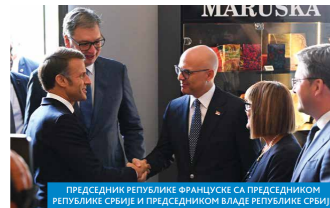
ПРЕДСЕДНИК РЕПУБЛИКЕ ФРАНЦУСКЕ СА ПРЕДСЕДНИКОМ РЕПУБЛИКЕ СРБИЈЕ И ПРЕДСЕДНИКОМ ВЛАДЕ РЕПУБЛИКЕ СРБИЈЕ

дајући да Србија за десет година неће имати довољно електричне енергије уколико не буде користила нуклеарну енергију.