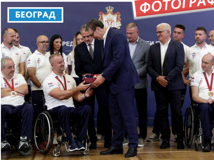
ПРИЈЕМ ЗА УЧЕСНИКЕ ПАРАОЛИМПИЈСКИХ ИГАРА У ПАРИЗУ И ЧЛАНОВЕ ЊИХОВИХ СТРУЧНИХ ШТАБОВА, КОЈИ СУ ОСВОЈИЛИ ШЕСТ МЕДАЉА