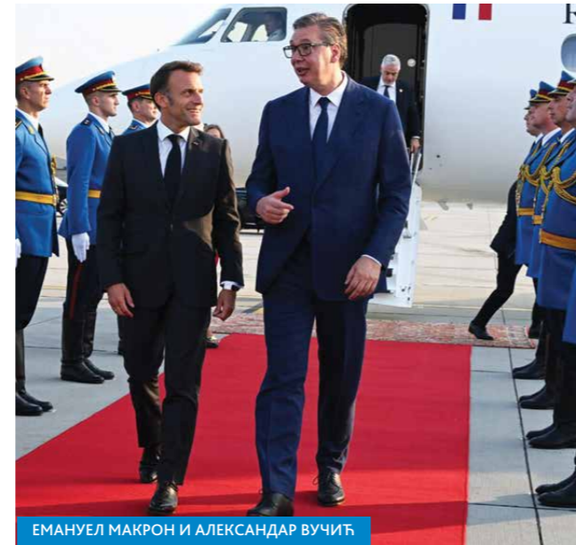
ЕМАНУЕЛ МАКРОН И АЛЕКСАНДАР ВУЧИЋ

Председник Србије Александар Вучић гостио је у Београду и Новом Саду председника Француске Емануела