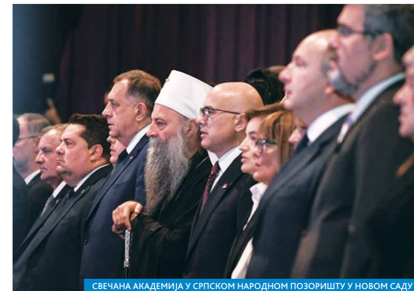
СВЕЧАНА АКАДЕМИЈА У СРПСКОМ НАРОДНОМ ПОЗОРИШТУ У НОВОМ САДУ