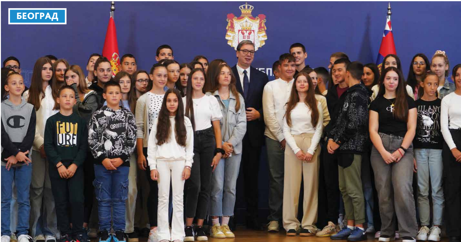
ПОВОДОМ ОБЕЛЕЖАВАЊА ДАНА СРПСКОГ ЈЕДИНСТВА, СЛОБОДЕ И НАЦИОНАЛНЕ ЗАСТАВЕ, ПРЕДСЕДНИК СРБИЈЕ АЛЕКСАНДАР ВУЧИЋ УГОСТИО ЈЕ УЧЕНИКЕ И НАСТАВНИКЕ ОСНОВНИХ ШКОЛА И ПРЕДСЕДНИКЕ ОПШТИНА ИЗ РЕПУБЛИКЕ СРПСКЕ И ЦРНЕ ГОРЕ