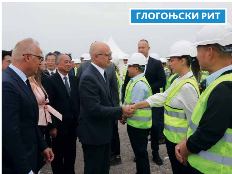
ОБИЛАЗАК РАДОВА НА ИЗГРАДЊИ АУТО-ПУТА БЕОГРАД-ЗРЕЊАНИН-НОВИ САД, НА ДЕЛУ ИЗМЕЂУ ГЛОГОЊСКОГ И ЈАБУЧКОГ РИТА