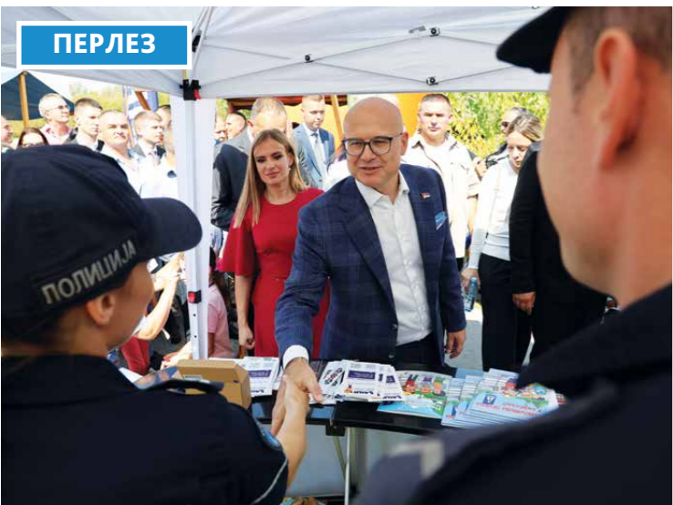
ПРЕДСЕДНИК ВЛАДЕ СРБИЈЕ МИЛОШ ВУЧЕВИЋ СА ГРАЂАНИМА И УЧЕСНИЦИМА МАНИФЕСТАЦИЈЕ ДАНИ ПОРОДИЦЕ