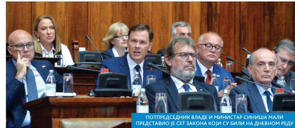
ПОТПРЕДСЕДНИК ВЛАДЕ И МИНИСТАР СИНИША МАЛИ ПРЕДСТАВИО ЈЕ СЕТ ЗАКОНА КОЈИ СУ БИЛИ НА ДНЕВНОМ РЕДУ

Током другог ванредног заседања Народне скупштине Републике Србије у четрнаестом сазиву расправљало се о ребалансу буџета за ову годину као и о сету закона за подстицај раста наталитета, развоја пољопривреде, здравства... Предлогом за измену Закона о буџету предвиђено је да буџет Србије износи 2.173 милијарде динара, односно да буде повећан за 132,5 милијарде динара.