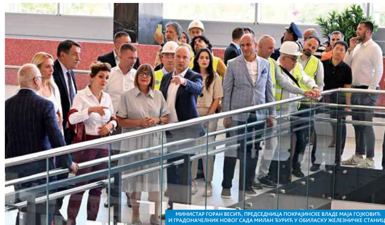
МИНИСТАР ГОРАН ВЕСИЋ, ПРЕДСЕДНИЦА ПОКРАЈИНСКЕ ВЛАДЕ МАЈА ГОЈКОВИЋ И ГРАДОНАЧЕЛНИК НОВОГ САДА МИЛАН ЂУРИЋ У ОБИЛАСКУ ЖЕЛЕЗНИЧКЕ СТАНИЦЕ

Елементи Споразума о слободној трговини између Србије и Кине представљени су у Градској кући, у присуству градоначелника Милана Ђурића, министра Томислава Момировића, председнице Покрајинске владе Маје Гојковић, председника Привредне коморе Марка Чадежа и амбасадора Кине Ли Минга. Градоначелник Ђурић, министар Горан Весић и председница