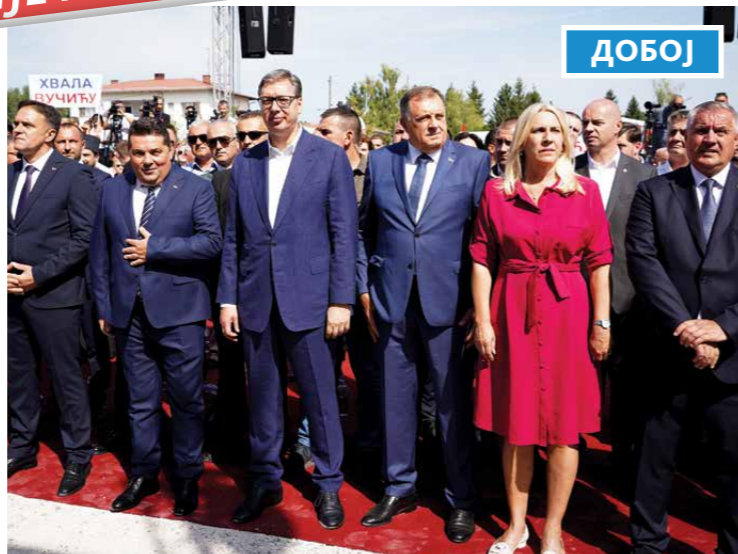
СВЕЧАНО ОТВАРАЊЕ НОВОИЗГРАЂЕНОГ ДОМА ЗДРАВЉА „СРБИЈА“ У СТАНАРИМА У РЕПУБЛИЦИ СРПСКОЈ