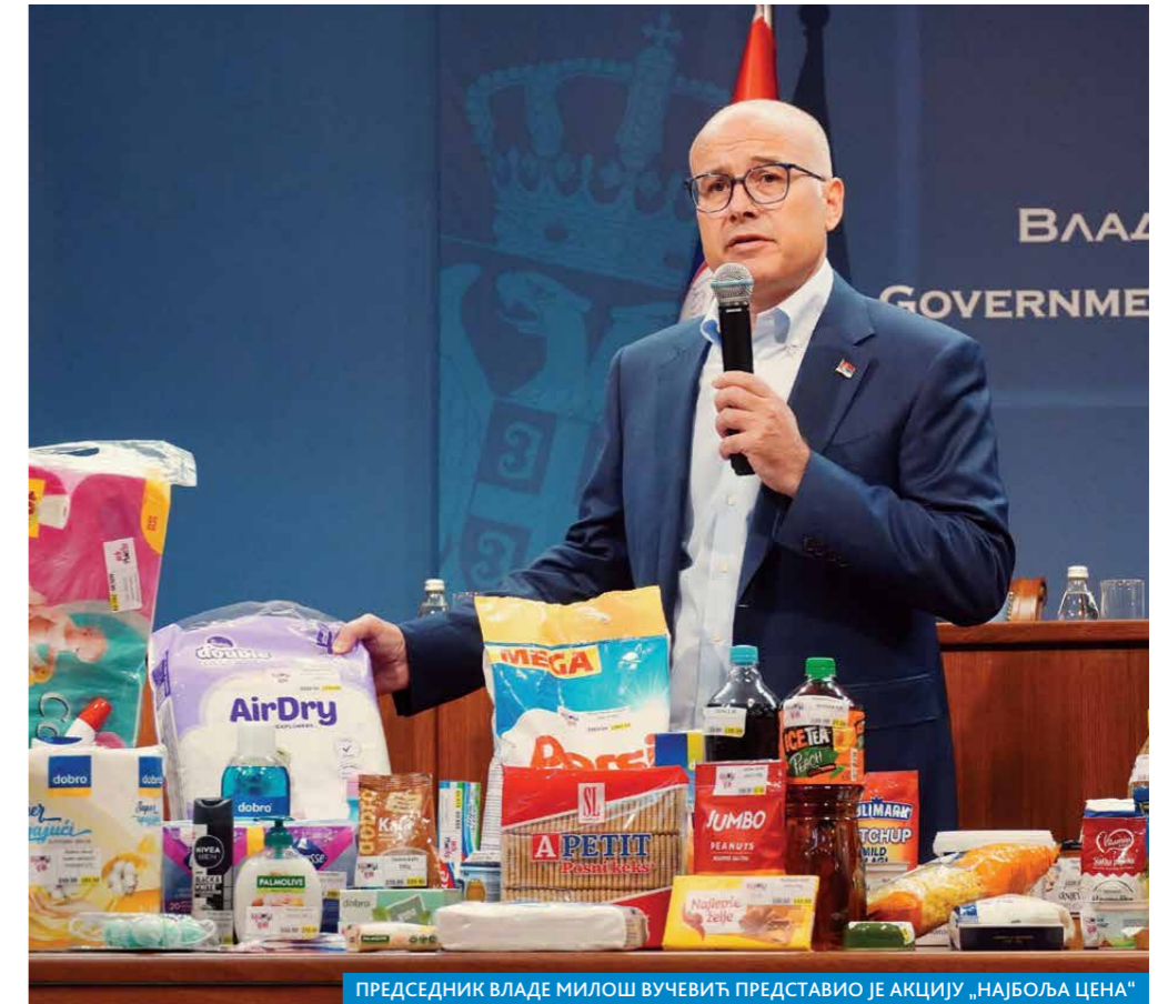
ПРЕДСЕДНИК ВЛАДЕ МИЛОШ ВУЧЕВИЋ ПРЕДСТАВИО ЈЕ АКЦИЈУ „НАЈБОЉА ЦЕНА“

блем да ико има профит, али имам проблем ако неко ствара екстра профит. Влада