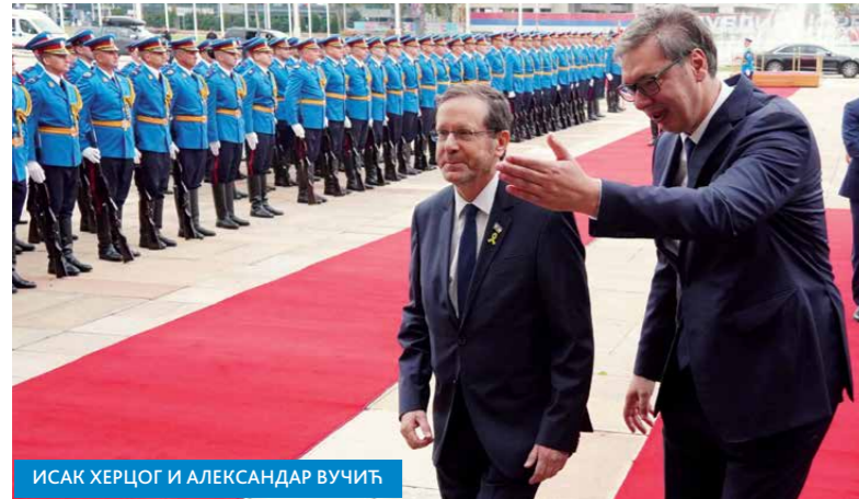
ИСАКА ХЕРЦОГ И АЛЕКСАНДАР ВУЧИЋ

ших народа. Постоји заиста велики афинитет и способност обе стране да се постигну споразуми који се потписују", поручио је председник Херцог