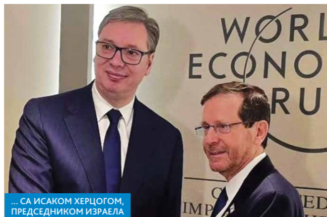
... СА ИСАКОМ ХЕРЦОГОМ, ПРЕДСЕДНИКОМ ИЗРАЕЛА