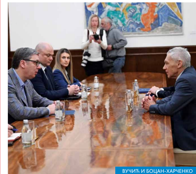
ВУЧИЋ И БОЦАН-ХАРЧЕНКО

Председник Србије Александар Вучић разговарао је са амбасадором Русије у Београду Александром Боцан-Харченком и затражио отпочињање консултација о функционисању НИС-а, након што су САД увеле санкције тој компанији.