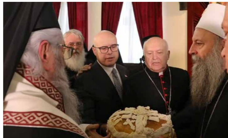
У ГОСТИМА КОД ПАТРИЈАРХА СРПСКОГ ПОРФИРИЈА, ПОВОДОМ КРСНЕ СЛАВЕ СВЕТОГ ЈОВАНА