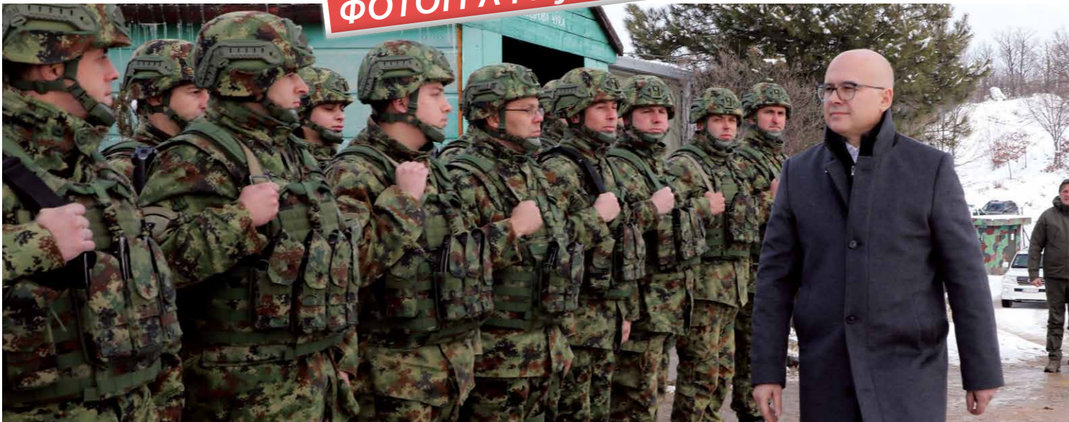
ПРЕДСЕДНИК ВЛАДЕ СРБИЈЕ МИЛОШ ВУЧЕВИЋ ПОСЕТИО ЈЕ ПРИПАДНИКЕ ЧЕТВРТЕ БРИГАДЕ ВОЈСКЕ СРБИЈЕ НА ПРВИ ДАН НОВЕ ГОДИНЕ ПО ЈУЛИЈАНСКОМ КАЛЕНДАРУ