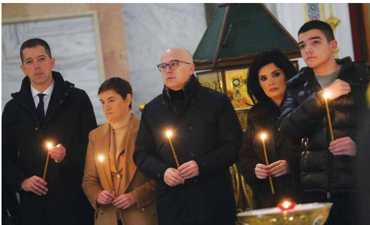
У ХРАМУ СВЕТОГ САВЕ, НА ПОМЕНУ ПОВОДОМ СЕДАМ ГОДИНА ОД УБИСТВА ОЛИВЕРА ИВАНОВИЋА, ПРЕДСЕДНИКА ГРАЂАНСКЕ ИНИЦИЈАТИВЕ СРБИЈА, ДЕМОКРАТИЈА, ПРАВДА