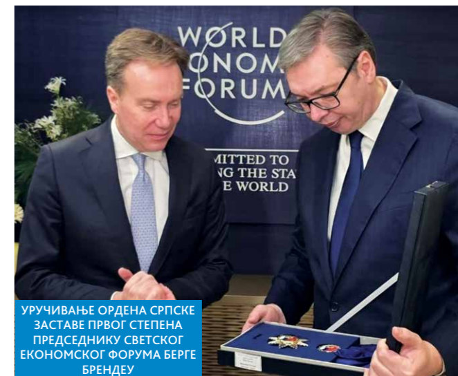
УРУЧИВАЊЕ ОРДЕНА СРПСКЕ ЗАСТАВЕ ПРВОГ СТЕПЕНА ПРЕДСЕДНИКУ СВЕТСКОГ ЕКОНОМСКОГ ФОРУМА БЕРГЕ БРЕНДЕУ