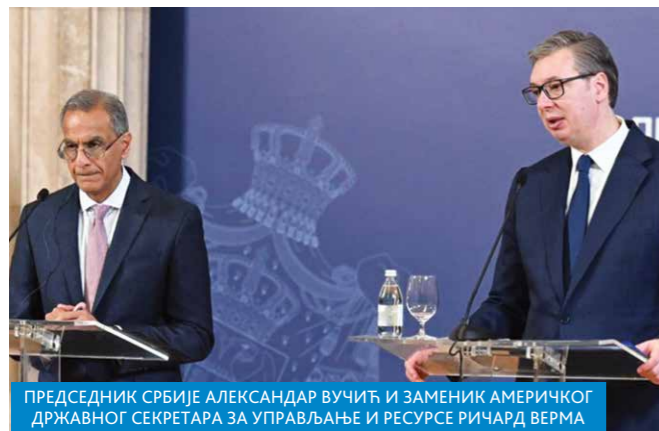
ПРЕДСЕДНИК СРБИЈЕ АЛЕКСАНДАР ВУЧИЋ И ЗАМЕНИК АМЕРИЧКОГ ДРЖАВНОГ СЕКРЕТАРА ЗА УПРАВЉАЊЕ И РЕСУРСЕ РИЧАРД ВЕРМА

Председник Србије Александар Вучић састао се са замеником америчког државног секретара за управљање и ресурсе Ричардом Вермом у Београду, са којим је разговарао о свеукупним српско-америчким односима, о успостављању стратешког дијалога који ће подићи на виши ниво односе две земље, о миру и стабилности у региону, као и о широком кругу тема, укључујући и рат у Украјини, али и санкције које су Сједињене Америчке Државе усмериле против руских ентитета широм света, укључујући и НИС.