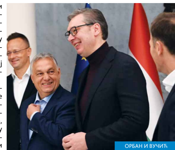
ОРБАН И ВУЧИЋ

Руски министар спољних послова Сергеј Лавров рекао је да је Руска Федерација у сталном контакту са Србијом и да је затражила хитне консултације у вези са ситуацијом након америчких санкција НИС-у.