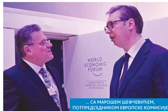
... СА МАРОШЕМ ШЕФЧЕВИЋЕМ, ПОТПРЕДСЕДНИКОМ ЕВРОПСКЕ КОМИСИЈЕ