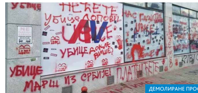
ДЕМОЛИРАНЕ ПРОСТОРИЈЕ СНС У НОВОМ САДУ

„Мислим да политика којој припадам, странка коју водим, која је побеђивала на свим изборима, мора да покаже највећи степен одговорности и да покаже нове закономерности, да покаже да је објективно најодговорнија. Зато након овог догађаја у Новом Саду моја је неопозива одлука да поднесем оставку. Јутрос сам дуго разговарао са председником, прихватио је моју одлуку, моје аргументе“, рекао је премијер Вучевић и објаснио да је веома важно да људи који су бирани покажу да су спремни да допринесу смиривању тензија.