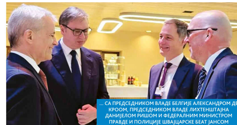
... СА ПРЕДСЕДНИКОМ ВЛАДЕ БЕЛГИЈЕ АЛЕКСАНДРОМ ДЕ КРООМ, ПРЕДСЕДНИКОМ ВЛАДЕ ЛИХТЕНШТАЈНА ДАНИЈЕЛОМ РИШОМ И ФЕДЕРАЛНИМ МИНИСТРОМ ПРАВДЕ И ПОЛИЦИЈЕ ШВАЈЦАРСКЕ БЕАТ ЈАНСОМ