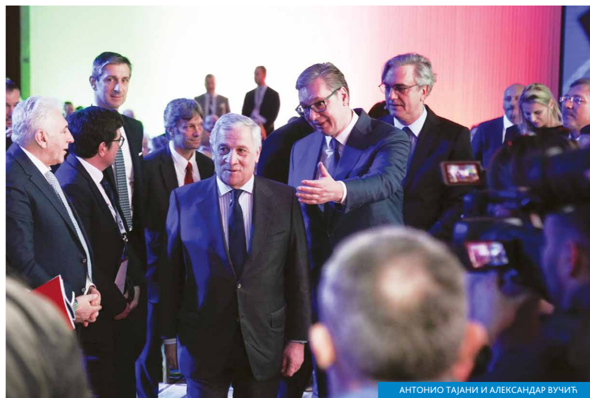
АНТОНИО ТАЈАНИ И АЛЕКСАНДАР ВУЧИЋ

Изразио је наду да се, у оквиру интерног тржишта ЕУ, може постићи снажније при-