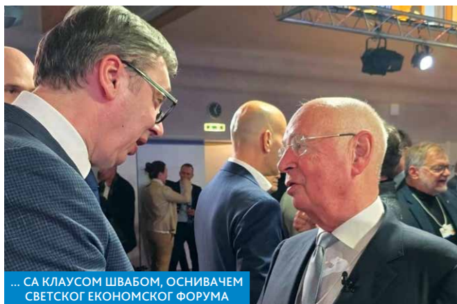
... СА КЛАУСОМ ШВАБОМ, ОСНИВАЧЕМ СВЕТСКОГ ЕКОНОМСКОГ ФОРУМА

„Они очекују пристојну стопу раста, али она није довољна, посебно зато што ће највећи део те добре стопе раста доћи из Азије. И Америка ће имати добру стопу раста, око 2,7 одсто, што је врло добро. Међутим, Европа је на дну. Срећом, ми ћемо покушати да будемо три до четири пута бољи од Европе у просеку, тако да се надам да ћемо, као Србија, моћи да се снајемо у свему томе“, поручио је председник Вучић.