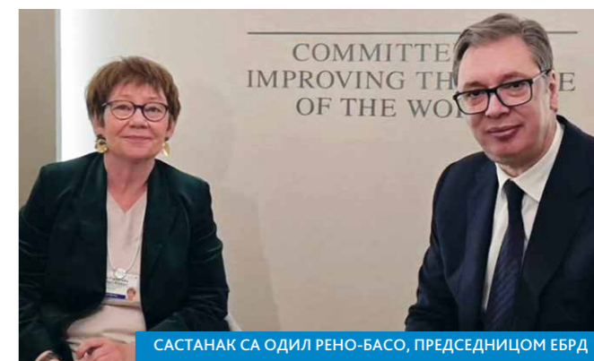
САСТАНАК СА ОДИЛ РЕНО-БАСО, ПРЕДСЕДНИКОМ ЕБРД

Председник Србије Александар Вучић учествовао је на овогодишњем састанку Светског економског форума у Давосу и, том приликом, имао је низ билатералних сусрета са светским и европским званичницима, као и бројне сусрете са представницима међународних организација, финансијских институција и водећих компанија, али и са представницима земаља које ће учествовати на изложби ЕКСПО 2027.